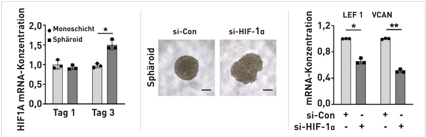
Die 3D-Kultur von DPCs zeigt eine hohe Expression von HIF1A und HIF-1 \alpha reguliert trichogene Gene in DPC-Sphäroiden. (Einzelheiten entnehmen Sie bitte dem Papier)