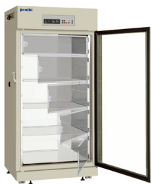
MCO-80IC mit optional erhältlichem Innentür-Bausatz (MCO-80ID-PW)