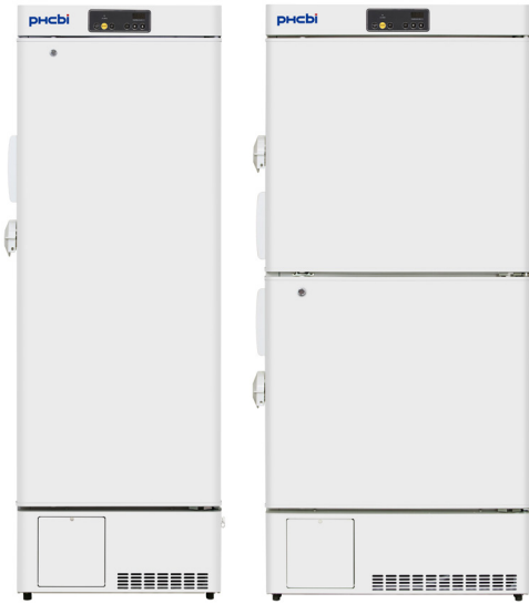
MDF-MU339HL-PE | MDF-MU539HL-PE