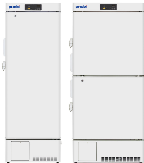
MDF-MU339HL-PE | MDF-MU539HL-PE