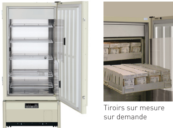
Tiroirs sur mesure sur demande