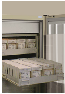
Sonderanfertigungen von Gestelle auf Anfrage