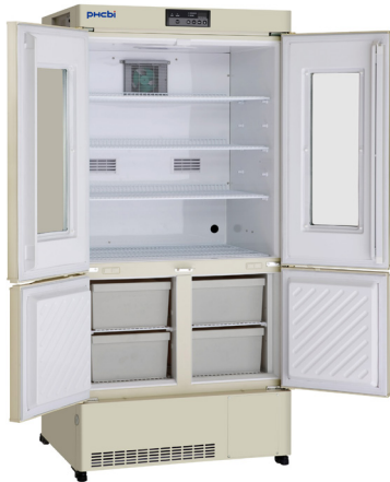
MPR-715F-PE con l'opzione MPR-715SC-PW