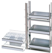
Estantes de alambre (izquierda), estantes deslizantes (derecha)