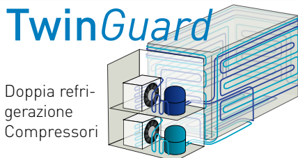
Doppia refrigerazione Compressori

Uno schermo touch screen LCD a colori permette il controllo completo da parte dell'utilizzatore, anche indossando i guanti, mentre la porta USB rende estremamente comodo il trasferimento dei dati registrati a un PC. Il design privo di filtri dei congelatori riduce la necessità di manutenzione ordinaria.