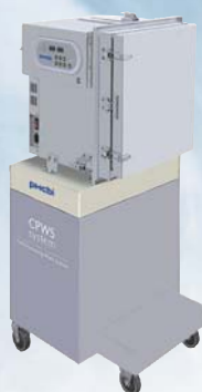
細胞培養モジュール