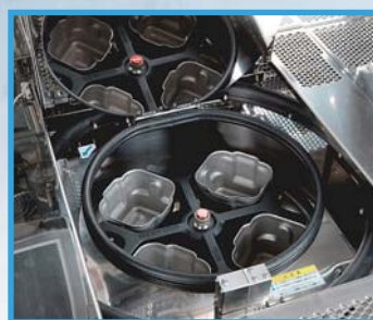
遠心分離モジュール