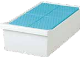
貯蔵ボックス：MDF-2081BXは別売です

標準の庫内容器は、小物の区分け整理に便利です。また、別売の貯蔵ボックス MDF-2081BXが24個収納可能。効率よくサンプルが保存できます。