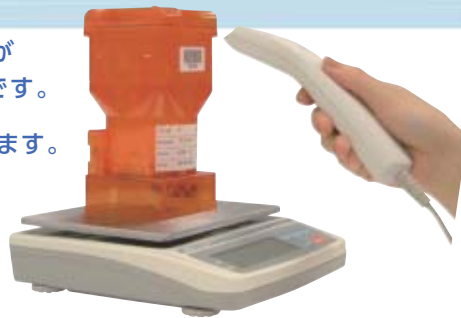
薬品の残量を自動計算