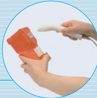
バーコードリーダーで照合

薬剤補充の際、補充する薬品容器とタブレットケースのバーコードをバーコードリーダーにより照合します。